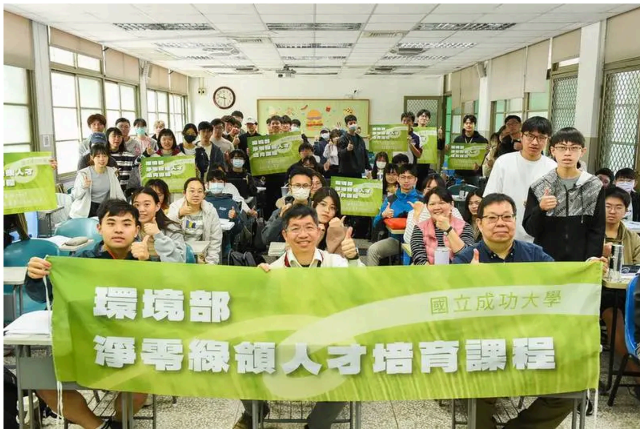
(圖說) 國立成功大學導入環境部淨零綠領人才培育內容，開設微學分課程。(記者鄭德政攝) 環工系大四張同學原本就計畫自費參加淨零綠領人才培訓課程，今年系上剛好開設微學分課程，讓她能在校內修課，也省下一筆培訓費用。她表示，目前部分課程內容與系上所學高度相關，但她也期待後半段課程探討碳邊境調整機制 (CBAM) 與碳盤查等較為進階的議題。