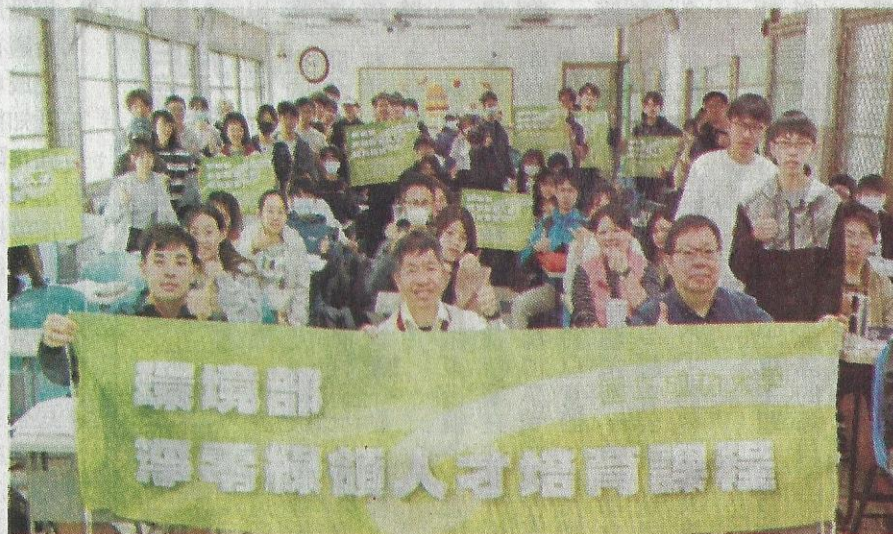
成大導入環境部淨零綠領人才培育內容，開設微學分課程。

本課程共計54小時、3學分，採產官學協力授課模式，邀請學界、業界及政府專家共同參與，師資陣容堅強。成大並串聯嘉義、台南、高雄及屏東等15所大專院校，共同推動南區綠領人才培育，為南台灣培育具備跨域能力與實務經驗的淨零永續新世代人才。