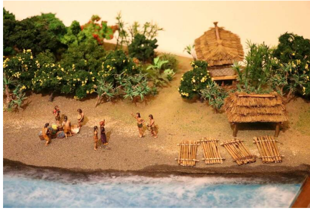
史前跨國交流場景。