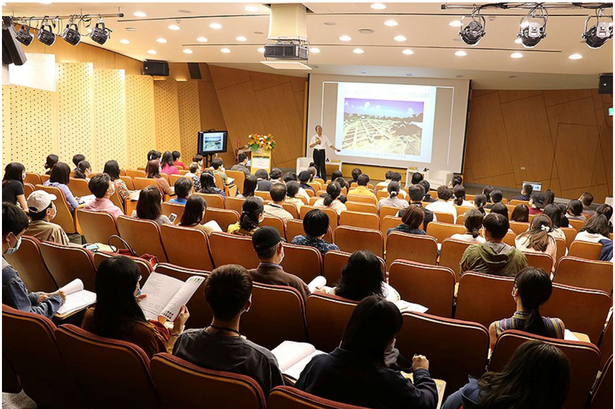
2023新北市國際考古論壇開始報名。

新北市立十三行博物館「新北市國際考古論壇」將於4月份登場，今年以「古代東亞海路交流探究」為主題，邀請臺、港、日、韓、澳的考古學、人類學、藝術史學、文化資產領域傑出學者，安排4場次專題演說與交流論壇。帶您一同探索史前到歷史時期臺灣與東亞地區的海路交流，內容豐富精采，歡迎踴躍報名。