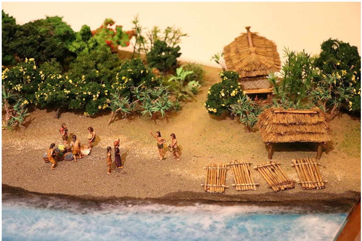
史前跨國交流場景。