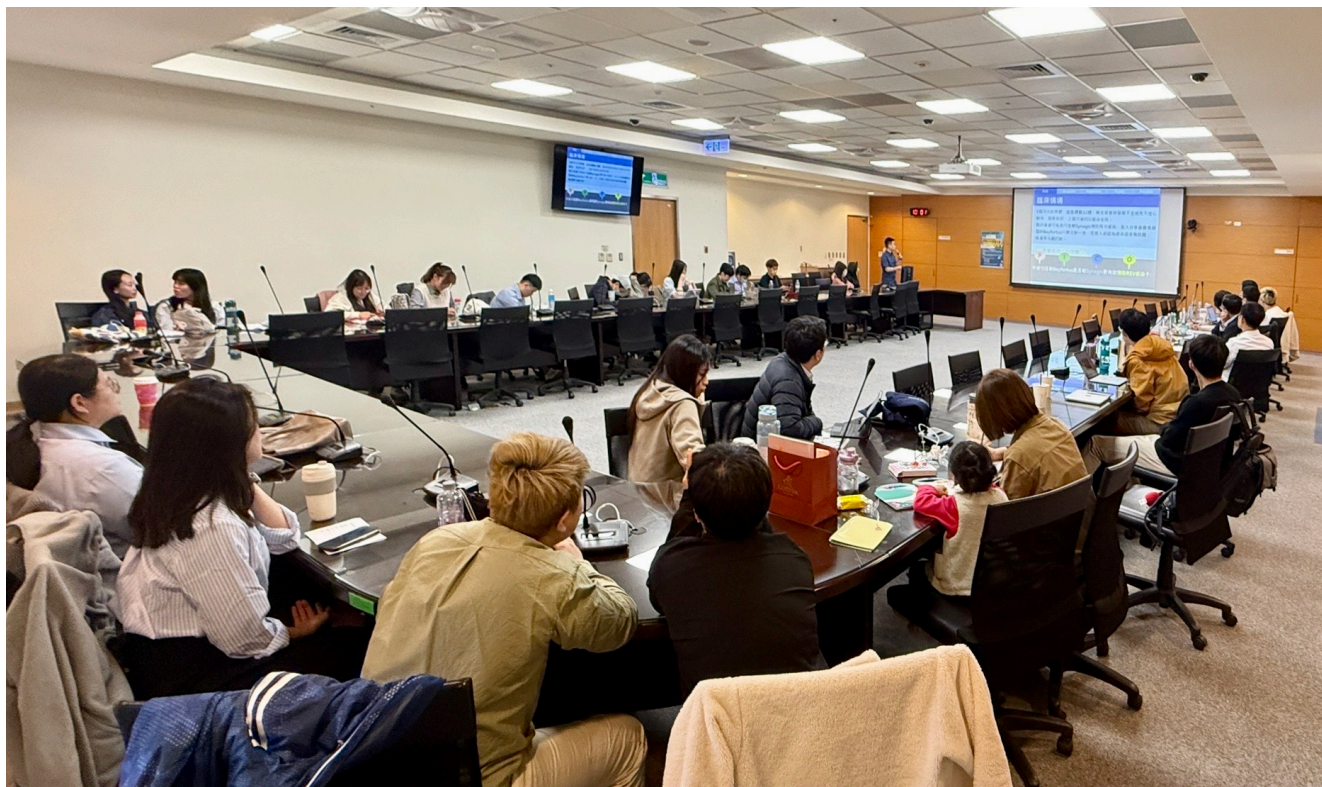
▲ 深化實證醫學文化 培育跨職類人才 成大醫院實證查證競賽圓滿落幕。

首屆「成醫EBM查證王者挑戰賽」的舉辦，不僅促進跨職類的學術交流，也為院內實證醫學文化奠定新的里程碑。教學中心將持續推動實證活動並培育更多醫學人才，讓實證精神在臨床照護中持續深化，為病人提供更精準且優質的醫療服務。