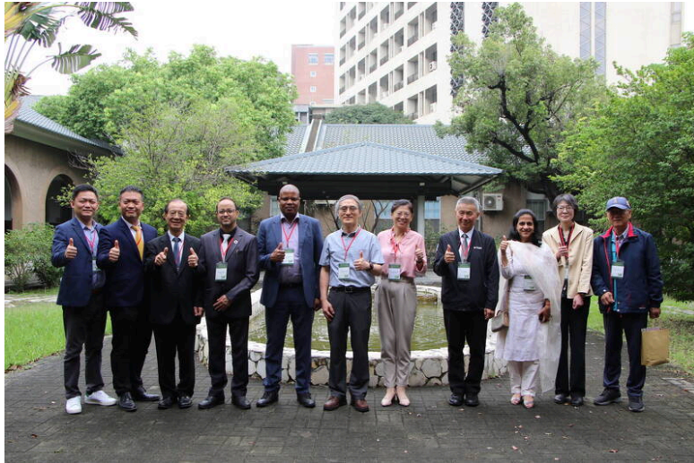
國際組織齊聚成大，支持里山權杖計畫與碳權機制，同時發表《台南宣言》。

「永續碳權里山里海地景對抗氣候變遷國際會議」今、明（8、9日）兩天在國立成功大學舉行，聯合國氣候變化綱要公約（UNFCCC）、聯合國開發計畫署（UNDP）等國際組織代表來台支持台灣的「里山權杖計畫」，並與學界共同發表《台南宣言》（Tainan Chapter），強調在落實國際環境政策的同時，維護原住民與地方社區權益，展現台灣在淨零減碳的全球實力。