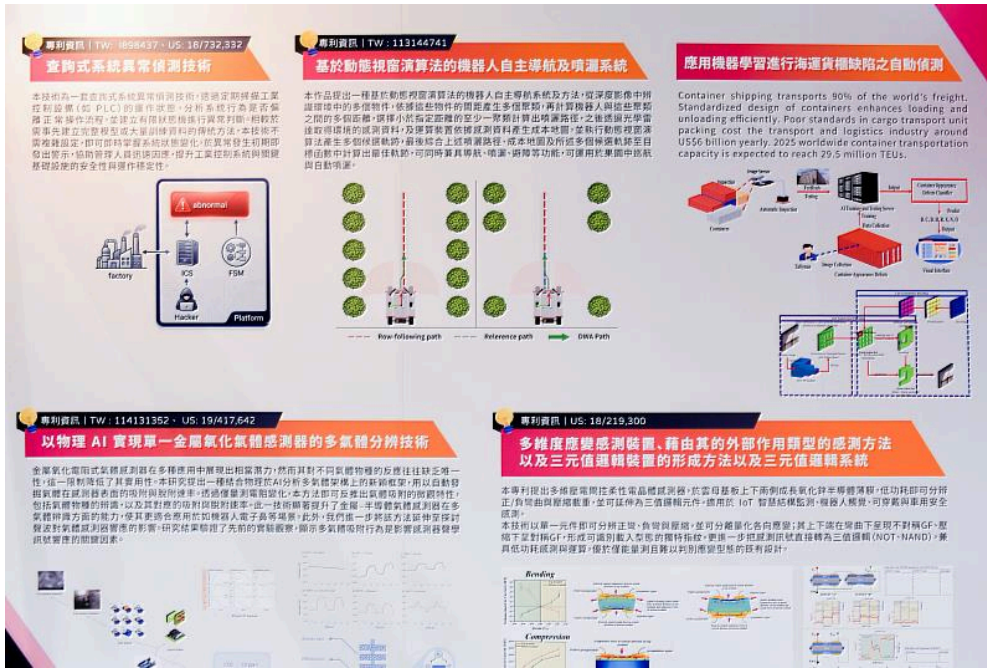
國立成功大學展出多項核心技術包括AI與物聯網、供應鏈資安，以及智慧機器人與移動載具。

在上述策略與制度支持下，相關研發成果亦於本次展會中具體呈現。成大展位精選多項深具商業應用潛力的技術成果，聚焦3大核心技術，包括AI與物聯網、供應鏈資安，以及智慧機器人與移動載具。