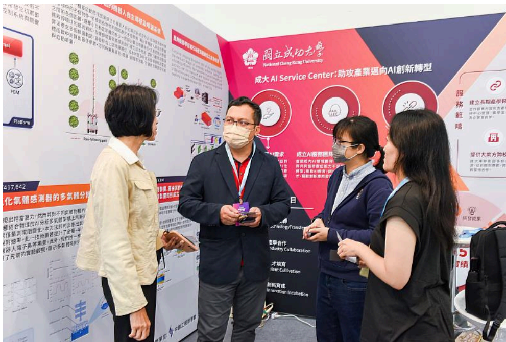
國立成功大學8日起參加2026 SMART+ 智慧製造展，產業先進於展區進行交流。

(中央社訊息服務20260408 15:20:31)在全球製造業加速推動智慧化與數位化轉型的關鍵階段，產業對AI應用的需求持續升溫。國立成功大學8日起於2026 SMART+ 智慧製造展，以「AI實戰落地」與「供應鏈韌性」為核心主軸，展出涵蓋海運、精密感測、資安防護及智慧載具等多項跨域研發成果。此次展出不僅展現成大深厚的研發量能，也具體呈現協助企業導入AI應用，提升智慧製造與營運效能的實踐路徑。