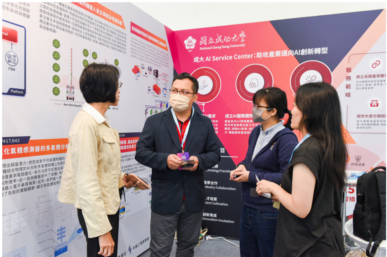
國立成功大學8日起參加2026 SMART+ 智慧製造展，產業先進於展區進行交流。

運、精密感測、資安防護及智慧載具等跨域研發成果。此次展出不僅展現成大深厚的研發量能，也呈現協助企業導入AI應用，逐步提升智慧製造與營運能力的實踐路徑。