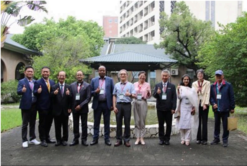
與會貴賓合影留念。

「永續碳權里山里海地景對抗氣候變遷國際會議」4月8日至9日於國立成功大學舉行。聯合國氣候變化綱要公約（UNFCCC / UNCC）、聯合國開發計劃署（UNDP）等國際組織官方代表跨海來台支持合作「里山權杖計畫」，與台灣學界共同發表《台南宣言》（Tainan Chapter），旨在緊密連結台灣社會發展與維護原住民與社區權益並接軌國際環境政策，向世界展現台灣在淨零減碳領域具備的全球實力。